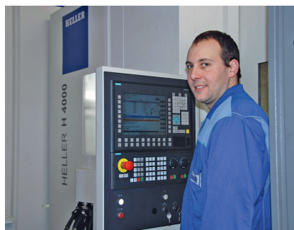
2 Bei automatisierten BAZ, die über einen Paletten-Container mit Werkstücken versorgt werden, erfolgt die Wertschöpfung mannlos

Ein Leitrechner übernimmt die Planung der Bearbeitung nach Termin- und Dringlichkeitspräferenzen der Auftragsvorbereitung. Wenn während Pausen, Urlaub oder Krankheit weniger Mitarbeiter anwesend sind, kann der Fertigungsverbund Aufträge mit weniger